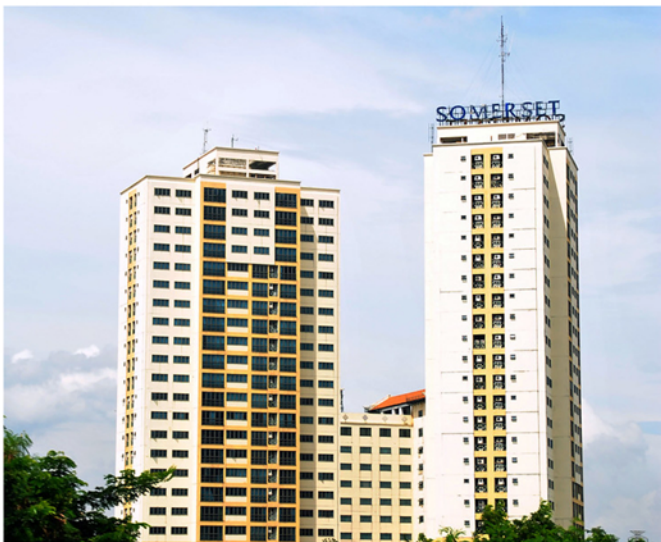
Apartemen Somerset Surabaya