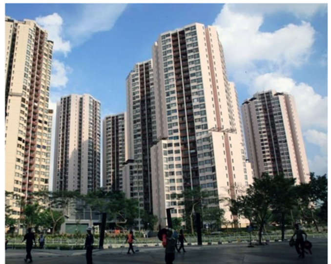
Apartemen Taman Rasuna