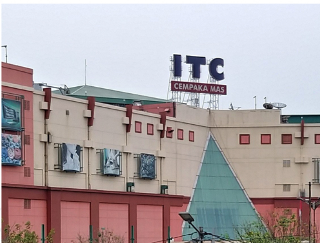
ITC Cempaka Mas