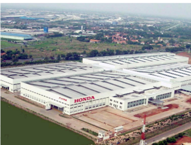
Astra Honda Motor Cikampek