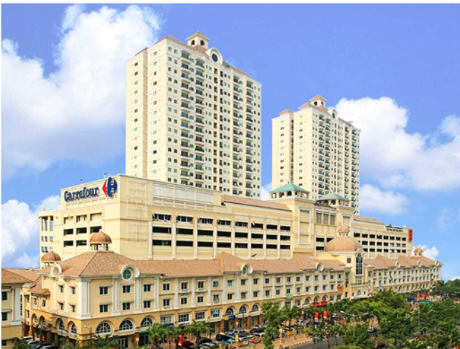
Grand ITC Permata Hijau