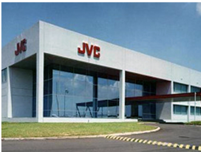
PT. JVC Electronics Indonesia