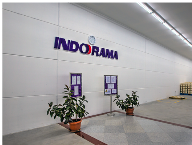
PT. Indorama Purwakarta