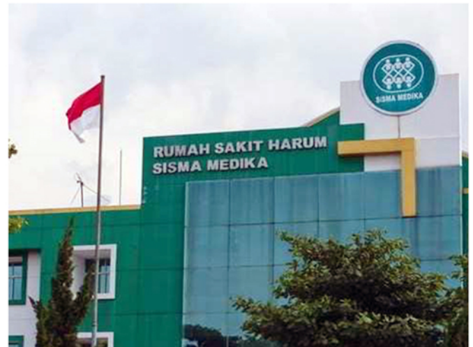
RS Harum Sisma Medika Bekasi