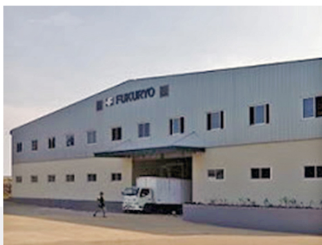
PT. Fukuryo Semarang