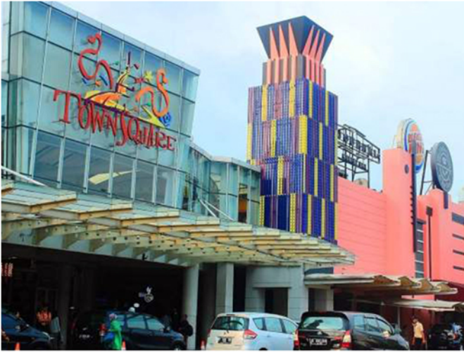
Cilandak Town Square