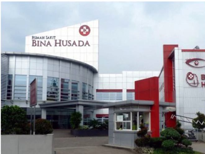
RS Bina Husada Cibinong