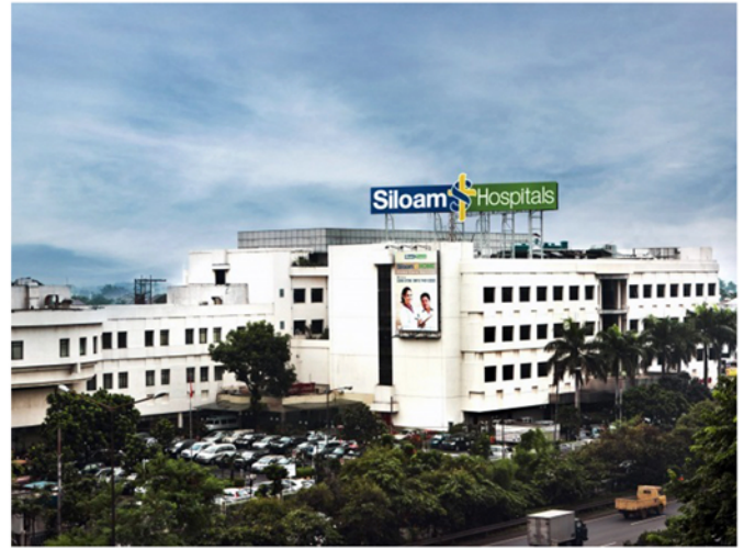
RS Graha Medika Kebon Jeruk