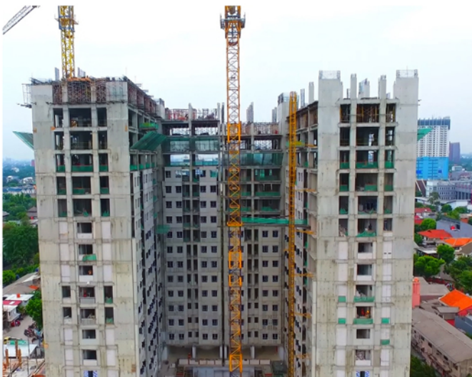
Rumah Susun Pasar Jumat