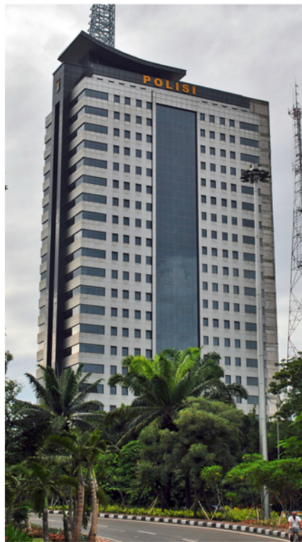
Gedung Polda Metro Jaya