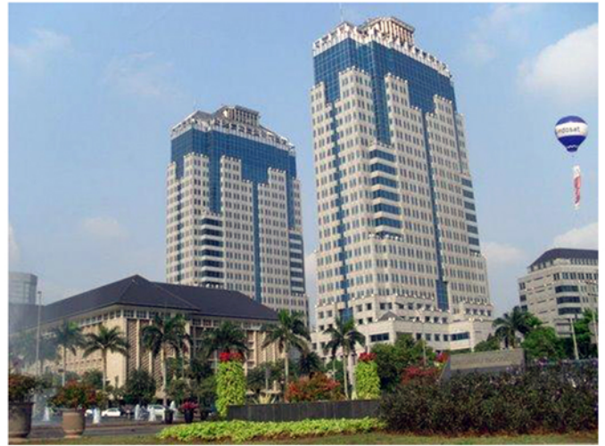
Gedung Bank Indonesia