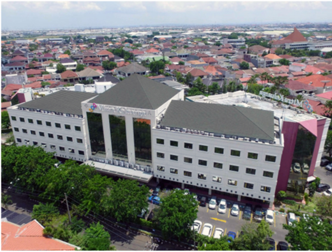
RS Mitra Keluarga Surabaya