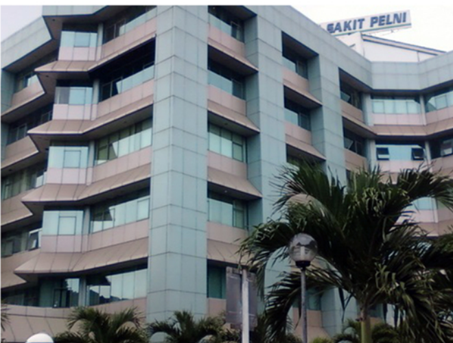
Poliklinik RS Pelni Petamburan