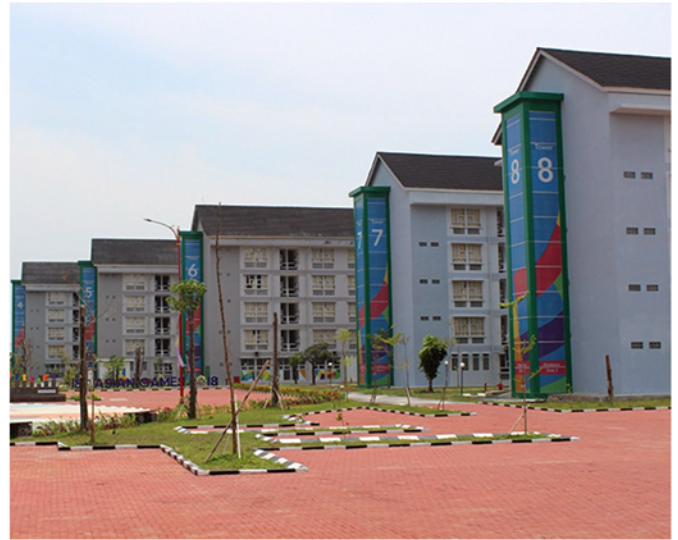
Wisma Atlet Jakabaring