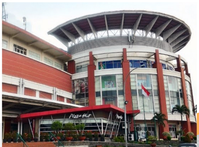
Mall Graha Cijantung