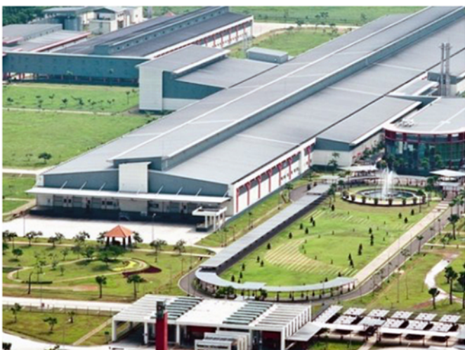
PT. HM Sampoerna Karawang