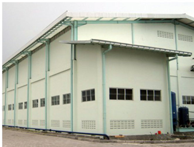
PT. Polytron Semarang