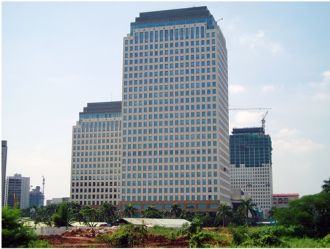
Gedung Sentral Senayan 1,2,3