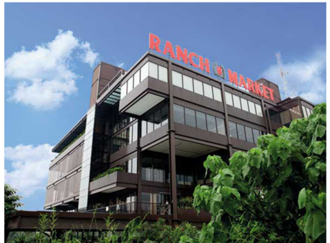
Ranch Market Pesanggrahan