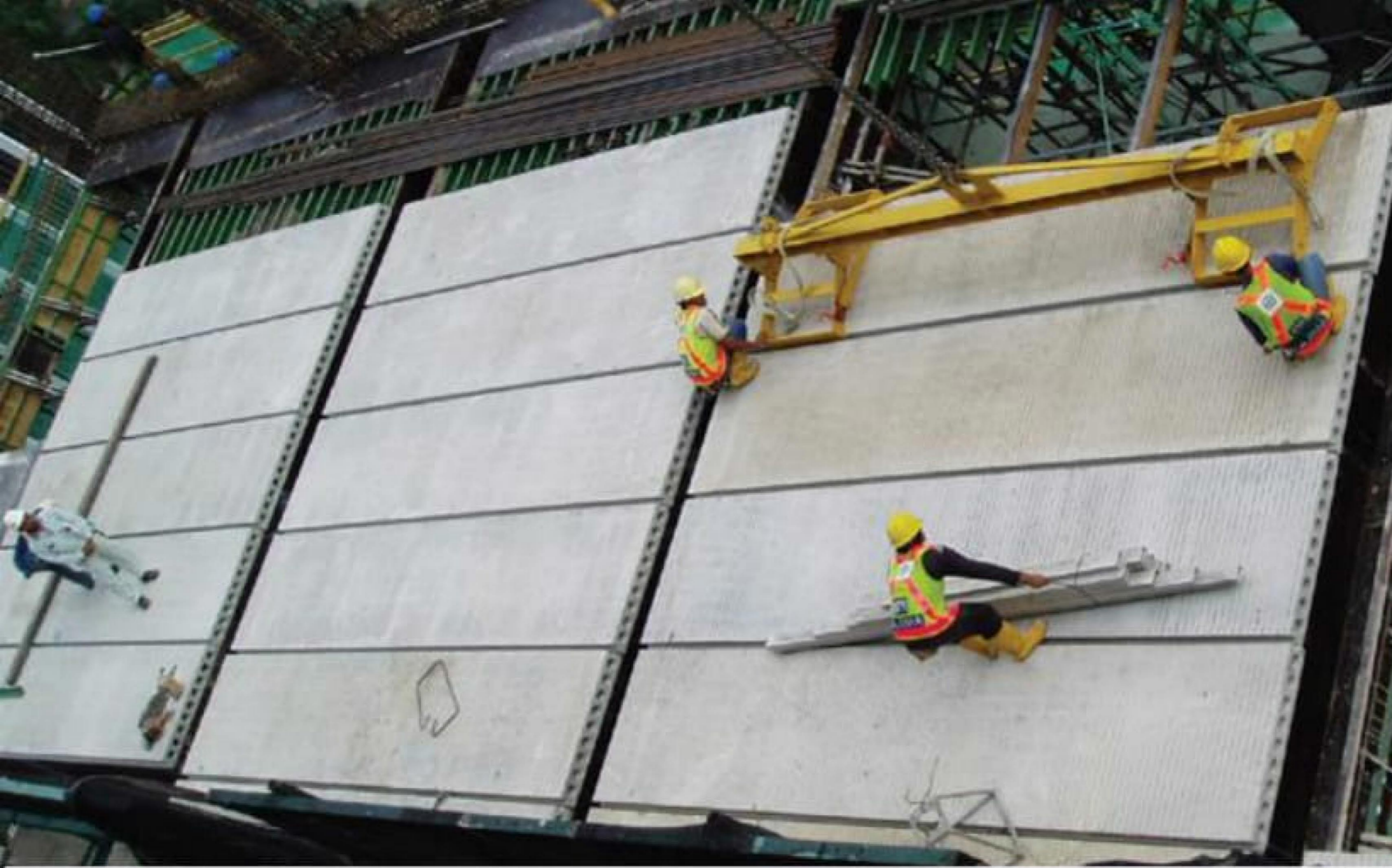
PEMASANGAN HCS SECARA SIMULTAN