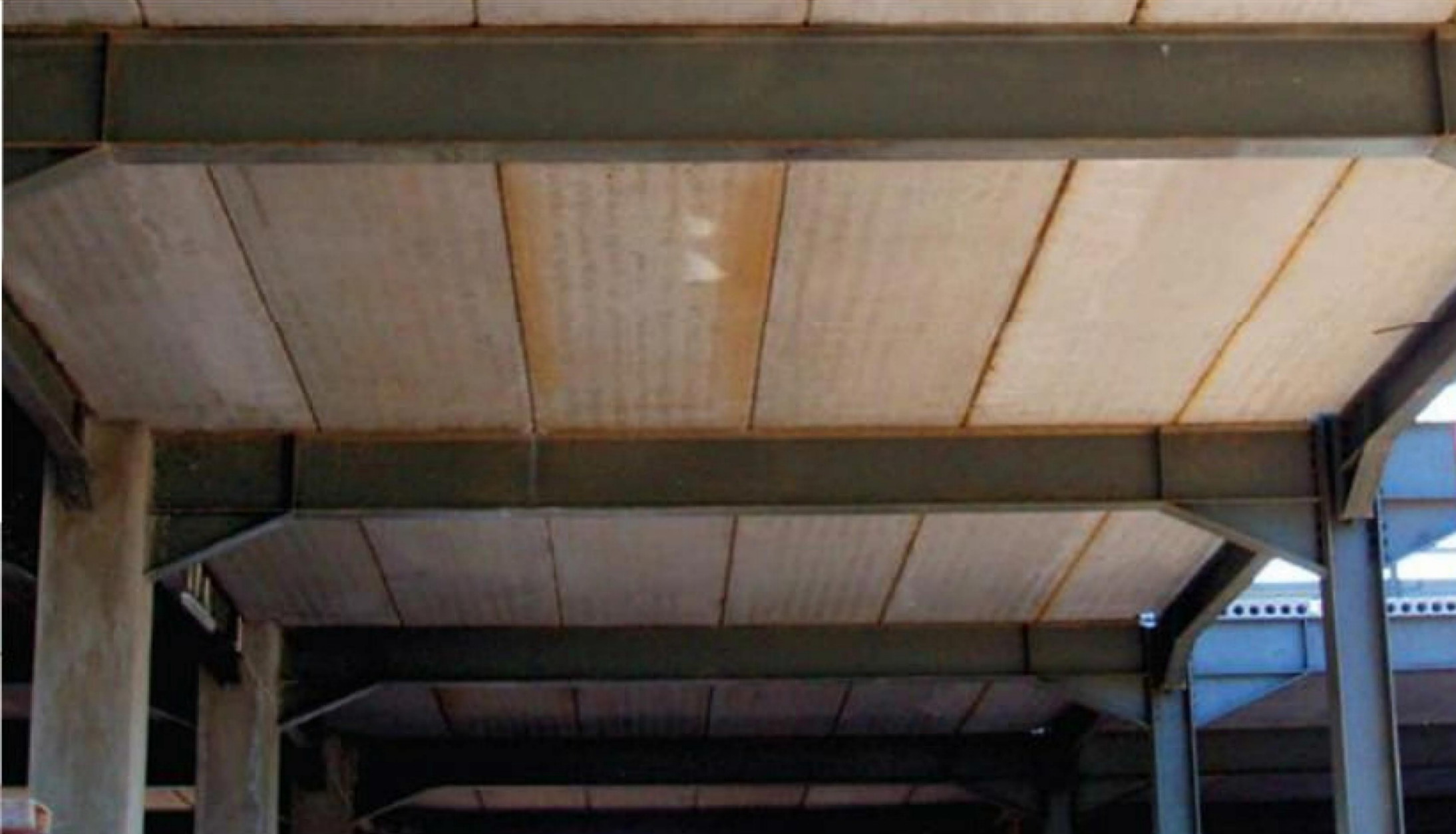
PEMASANGAN HCS PADA BALOK BAJA