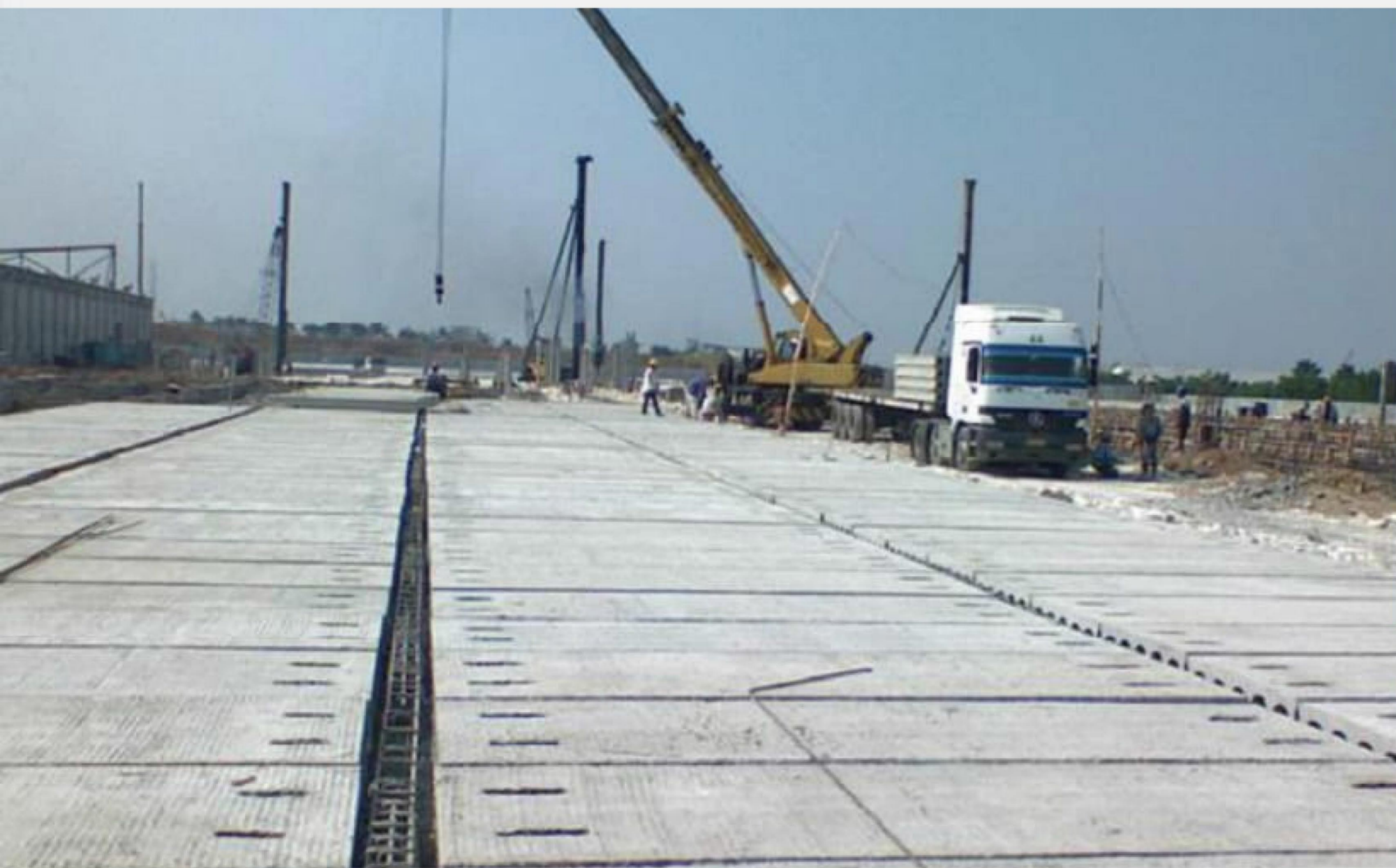
PEMASANGAN HCS PADA BALOK BETON